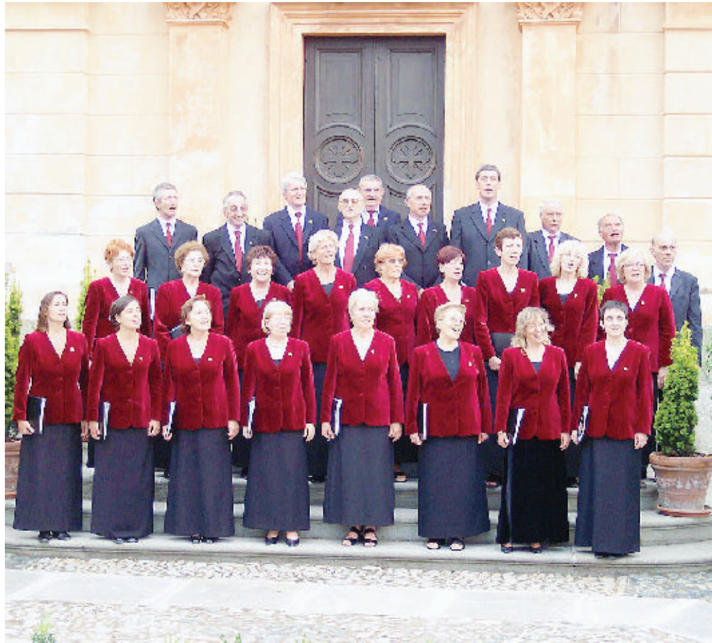
La corale Europa Cantat sarà protagonista a Piatto in occasione della VIII rassegna di canto popolare

Canti alpini, popolari e di montagna caratterizzeranno l'appuntamento con la XIV rassegna corale a cura del coro Ana La Ceseta, in programma, sempre sabato alle 21 ma nella chiesa parrocchiale di Sandigliano. Oltre