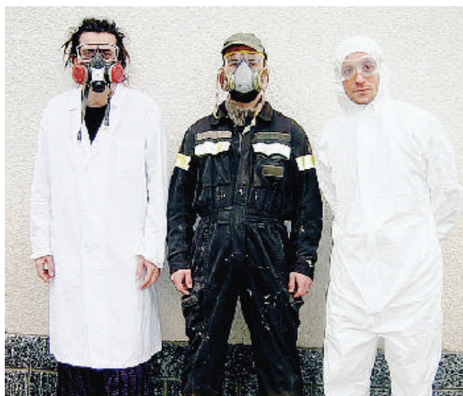
I Tongs suonano domani al Garage di Riva a Biella